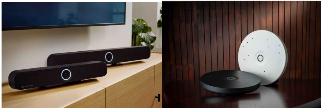
ゼンハイザーの TeamConnect Family ソリューション

また、Evolution Wireless Digital Familyに新たに加わった EW-DX を搭載した最先端のワイヤレスソリューションや、きれいな音質で簡単に対応でき、ライブ会場間の連携を実現する双方向ソリューション、 MobileConnect のライブデモを体験できます。