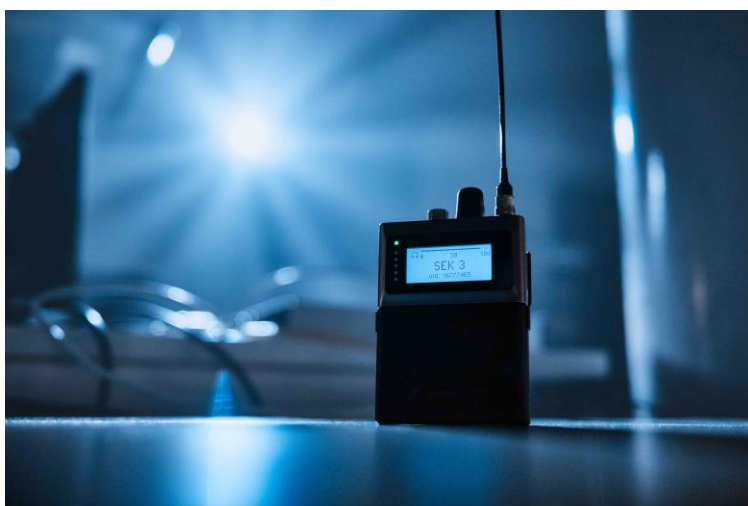
同じ広帯域 RF チャンネルでマイクと IEM オーディオの両方を処理しながら、データ管理も可能な Spectera SEK ボディパック

ゼンハイザーは、WMAS (Wireless Multi-channel Audio System) テクノロジーについての 10 年にわたる研究から生まれた、広帯域双方向の Spectera エコシステムの詳細を紹介します。来訪者は、マイクと IEM ボディパックの組み合わせによってシステムが生み出す音を聴くことができ、さらにゼンハイザーの RF エキスパートがこの画期的なテクノロジーについての質問に直接お答えします。